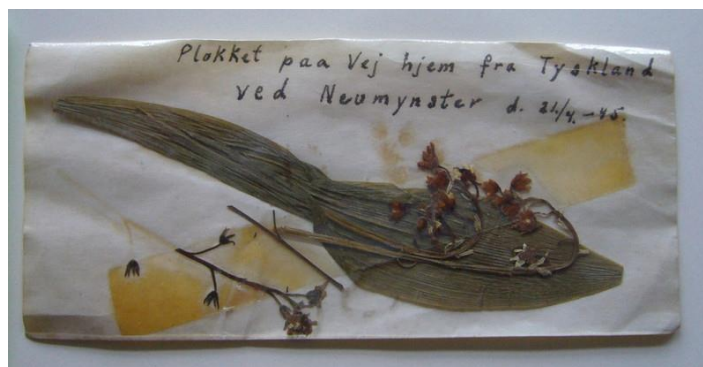
Et souvenir fra Helge Hansen til minde om sin befrielse: En lijlekonval, plukket under hans vej hjem fra Tyskland ved Neumünster den 21.4.45