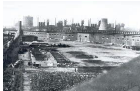
Fábrica "Hermann Göring" en Salzgitter, 1944, campo exterior Drütte.

A partir de 1942 el ministerio de armamento y la industria exigieron aumentar el empleo de prisioneros como mano de obra. A este fin se construyeron numerosos campos exteriores cerca de las fábricas y obras de construcción, la mayoría de estos campos en el último año de la guerra. En total se construyeron más de 85 campos exteriores de Neuengamme en: Hamburgo, Brema, Salzgitter, Hildesheim y Porta Westfalica.