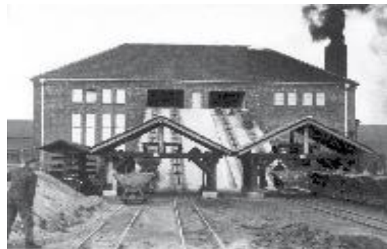
La fábrica de ladrillos

trabajar arduamente. Fueron obligados a trabajar en: la construcción del campo de prisioneros, el campo de la SS, la nueva fábrica de ladrillos, así como otros centros de producción. Las obras para hacer navegable el río "Dove Elbe" y la realización de un canal con una dársena fueron ejecutados bajo las más terribles condiciones de trabajo. En 1942 se puso en marcha la nueva fábrica de ladrillos, para lo que los prisioneros fueron obligados a trabajar en las minas de arcilla. En 1943 comenzó la producción de elementos prefabricados de hormigón para refugios antiaéreos y residencias transitorias. En la segunda mitad de la guerra, tuvieron prioridad los trabajos en fábricas de armamento en el campo – los centros de producción de las empresas Messap y Jastram y las empresas metalúrgicas de Neuengamme "Walther-Werke" - y en las propias fábricas de equipamiento de la SS. La jornada laboral era de 10 a 12 horas diarias; en invierno algo menos.