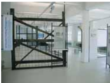
La exposición principal:

En el lugar conmemorativo del campo de concentración de Neuengamme hay 5 exposiciones permanentes: La exposición principal "Huellas en el tiempo: el campo de concentración de Neuengamme 1938-1945 y su historia posterior", la exposición de estudios en los garajes antiguos de la SS "Departamento campo de concentración: la SS del campo" y la exposición adicional "Trabajo y aniquilamiento: trabajos forzados en la fábrica de ladrillos del campo de concentración". Además hay la exposición en el edificio antiguo de los "Walter-Werke" llamada "Movilización para la economía de guerra: trabajos forzados en la producción de armamento". Existe otra exposición instalada en los restos de las paredes de la cárcel llamada "Cárceles y lugares conmemorativos: documentaciones de una contradicción".