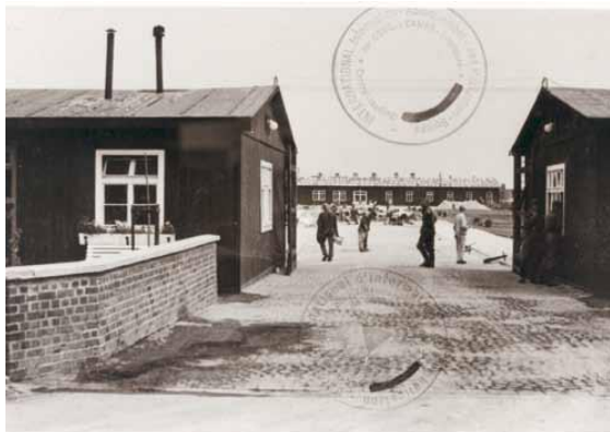
Entrada al campo, vista a las obras de pavimentación en la plaza central para el recuento de los prisioneros

Desde 1938 hasta 1945 el campo de concentración más grande del noroeste de Alemania estaba situado en Neuengamme. El motivo para la creación de este campo fue la producción de ladrillos para las grandes obras del régimen nacionalsocialista. Durante la guerra, la Gestapo y la SS ("Schutzstaffel") deportaron decenas de miles de personas de los países europeos ocupados como prisioneros al campo de concentración de Neuengamme.