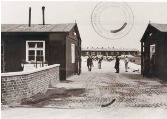
Entrada al campo, vista a las obras de pavimentación en la plaza central para el recuento de los prisioneros

Desde 1938 hasta 1945 el campo de concentración más grande del noroeste de Alemania estaba situado en Neuengamme. El motivo para la creación de este campo fue la producción de ladrillos para las grandes obras del régimen nacionalsocialista. Durante la guerra, la Gestapo y la SS ("Schutzstaffel") deportaron decenas de miles de personas de los países europeos ocupados como prisioneros al campo de concentración de Neuengamme.