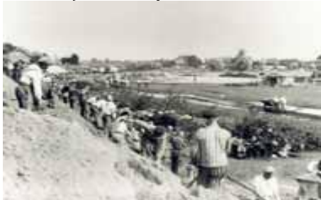
Prisioneros trabajando en los taludes del dique de Neuengamme.

Los prisioneros del campo de concentración fueron asignados a trabajar en las empresas de la SS, sacando así provecho financiero de su mano de obra. En abril de 1938 la SS fundó la "Deutsche Erd- und Steinwerk GmbH (DESt)", empresa que compró la fábrica de tejas y ladrillos en Neuengamme y que para ese momento estaba clausurada. En diciembre de 1938 llegaron los primeros prisioneros desde Sachsenhausen. Los prisioneros del campo de concentración de Neuengamme tuvieron que