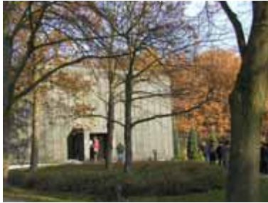
La casa conmemorativa

con vista al monumento conmemorativo internacional, hay siete vitrinas, en las que se hallan los registros de defunciones manuscritos de la enfermería del campo de prisioneros.