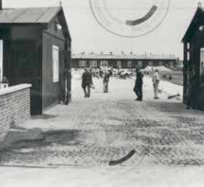
ممر خروج من معسكر الاعتقال في نونينغامه