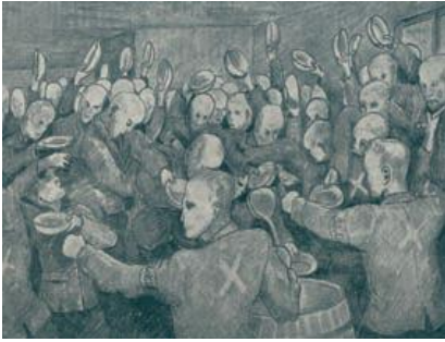
Распределение супа. Рисунок бывшего заключённого Ханса Петера Соренсена.

Голод занимал все мысли заключенных концлагеря, он зачастую руководил их действиями. Питание было недостаточным, еда – часто несъедобной. Ради собственной выгоды СС давали заключенным меньше пищи, чем им полагалось официально. С утра заключенные получали жидкий молочный суп или так называемый «кофе», на обед – баланду (жидкий суп с брюквой, практически без жиров). Некоторые заключенные получали в дополнение к этому бутерброд в качестве «надбавки занятым на особо трудных работах». Вечером выдавали хлебный паёк на следующий день.