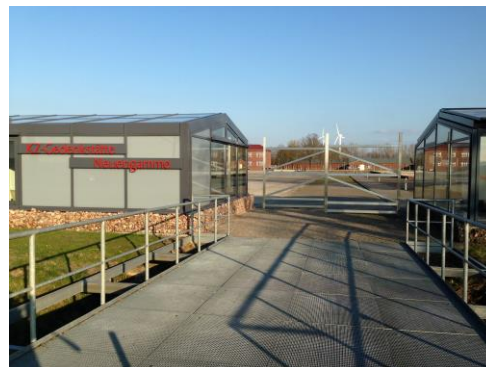
Главный вход в Мемориал.

семинаров – все это помогает сохранять память о прошлом.