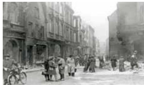
Подразделение заключенных из женского внешнего лагеря Бремен-Обернхайде.

Первое отделение концлагеря Нойенгамме открылось на базе военного предприятия в Виттенберге в августе 1942г.. Во второй половине войны концлагерь Нойенгамме имел более 60 внешних лагерей для мужчин. Десятки тысяч мужчин из оккупированных стран использовались в качестве рабочих. Они работали в военной промышленности, строили бункеры, промышленные объекты и подземные производственные предприятия, сооружали противотанковые рвы, использовались при расчистке завалов после бомбежек и на ремонте дорог. В 24 женских внешних лагерях, которые в 1944-1945гг. относились к основному концлагерю Нойенгамме, находились женщины из Советского Союза, Чехословакии, Венгрии, Польши, Словении, Франции, Бельгии, Нидерландов и Германии. Они работали на производстве оружия, расчистке завалов и в строительстве.