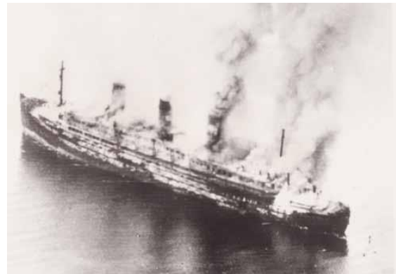
Горящий корабль «Кап Аркона» 3 мая 1945г.

друг к другу. Некоторые, не выдержав, умерли от голода, жажды и от общего истощения. 3 мая 1945г. во время воздушного налета и бомбежки британских союзников на этих кораблях погибло почти 7000 заключённых – одни не смогли спастись из огня, другие утонули, некоторые были застрелены. Выжило 450 человек.