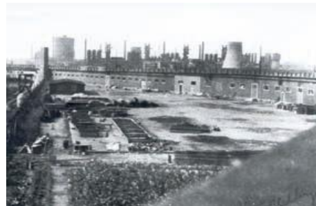
Предприятие «Герман Геринг» в Зальцгиттере. 1944г. Внешний лагерь «Дрютте».

более 85 таких лагерей. Рядом с Гамбургом филиалы находились в Бремене, Ганновере, Зальцгиттере, Хильдесхайме и Порта-Вестфалике.