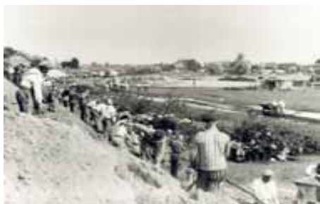
Заключенные Нойенгамме на строительстве отводного канала с гаванью.

Узники концлагерей использовались как рабочая сила на предприятиях СС с серьезной финансовой выгодой. В апреле 1938г. было основано предприятие «Немецкие земляные и каменные работы» (DESt). Для этих работ был приобретён заброшенный кирпичный завод в Нойенгамме. В декабре 1938 г. на завод отправили первую партию узников концлагеря Заксенхаузен. Заключенные концлагеря Нойенгамме были заняты тяжелым физическим трудом.